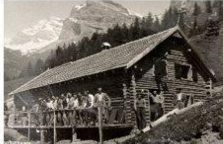
Cabane emportée par une avalanche en 1944

On devine sur la gauche du sentier l'emplacement où se situait le logement des ouvriers, la cantine et le bureau de la mine (cabane). Quelques pas plus loin, en contrebas, la zone du silo (1680 m) pouvant réceptionner 1'000 tonnes de minerai qui arrivait par des téléphériques à va-et-vient depuis les chantiers d'extraction supérieure (1920 m) et inférieure (1720 m). Par la suite, le minerai de fer était acheminé par le 2 ème télé (1942) en direction de la voie CFF vers Saint-Pierre-de-Clages. Les splendides maçonneries bien visibles formaient les structures servant de base à la station supérieure de ce dernier. Il est à souligner que jamais aucune once de minerai n'a emprunté les bennes de ce dernier téléphérique, la mine ayant été mise en faillite entre-temps.