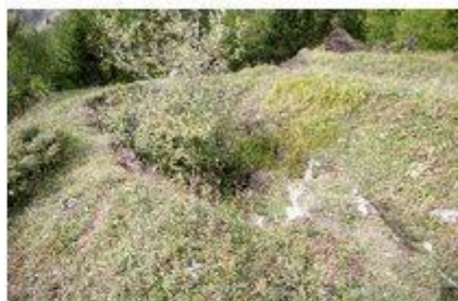
Emplacement du puits

Après le franchissement du petit torrent, vous passerez devant l'entrée éboulée de la galerie d'exploration 1. Le but de cette galerie était de déterminer la situation de la couche productrice afin de l'exploiter à ciel ouvert après élimination de la couverture superficielle. Il était prévu, après extraction, d'amener le matériel récolté à un puits (obstrué mais l'emplacement est toujours bien visible) qui aboutissait dans la galerie 1b (on devine la sortie de cette dernière malgré son éboulement), puis par wagonnet Decauville, dirigé vers le départ du téléphérique va-et-vient (socle toujours visible avec béton et parties métalliques) qui amenait après transfert ses bennes vers le silo visité au point 3. Des amoncellements de minerai sont toujours visibles dans les environs immédiats de ces dernières installations.