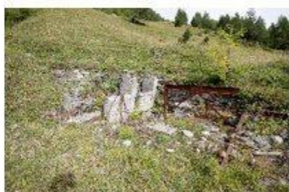
Station de départ du va-et-vient

En bordure du replat, vers le sud, au bord de la rupture de pente, le socle en béton du pylône de départ de la station supérieure du téléphérique 1 la mine-Pathier est toujours bien visible (voir photo à droite). La vue montre un dépôt de minerai et la sortie éboulée de la galerie 1b.