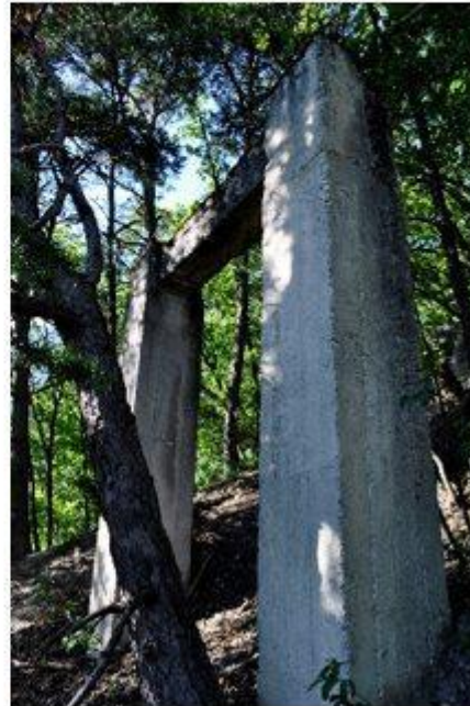
Portique de soutien station intermédiaire

D'une longueur totale de 6 km sur une différence de niveau de 1145 m, ce téléphérique était prévu pour transporter 35 tonnes/h de minerai à l'aide de 60 bennes de 450 litres chacune. On peut encore voir, au Grugnay sur rive gauche du Saint André, sur la route qui monte après la