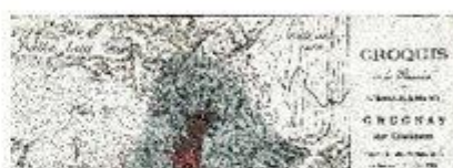
Relevés du glissement de 1906 (Schardt)

Prendre le chemin à droite qui se dirige vers Némiaz. Vous vous trouvez sur la langue terminale du fameux glissement. Remonter sur ce bon sentier jusqu'à la hauteur d'un mur en pierres sèches dans un pré situé sur votre droite. Longez le bas de ce mur jusqu'à un petit vallon marécageux, traversez-le, puis empruntez un petit chemin qui se dirige vers le Sud. Avant d'arriver au virage contournant la crête descendant de Némiaz, empruntez sur votre gauche une piste ascendante afin d'arriver au point 13.