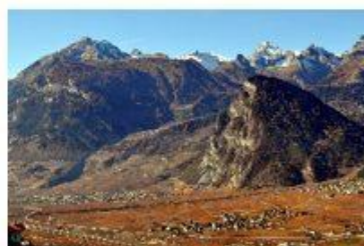
Le vignoble entre Saint-Pierre-de-Clages et Chamoson

Le réputé vignoble chamosard couvre une superficie de 423 ha et s'étend de 450 à 750 m faisant de Chamoson la plus grande commune viticole valaisanne. Le morcellement des parcelles, une des caractéristiques de la vigne en Valais, fait que l'on trouve dans cette commune plus de 1'200 propriétaires de vignes. Si le cœur vous en dit, 35 encaveurs pourront vous faire déguster leurs nectars sans pareil.