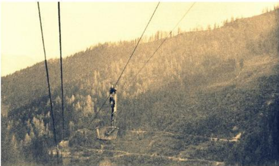
Le premier téléphérique, vue en direction de Pathier

Si certains socles dont l'utilité est facilement identifiable, d'autres en revanche demeurent dans l'ombre du mystère. Le minerai était chargé ensuite, depuis la station de base, sur des chars ou des camions qui circulaient sur la route en contrebas en direction de la fonderie. En 1942 le téléphérique est utilisé pour acheminer sur le site de la mine le matériel de construction des nouvelles installations du 2 ème téléphérique. L'exploitation a été reprise entre-temps par Dormann qui a créé la société : Mines de fer de Chamoson SA.