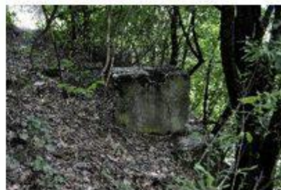
Socle du pylône d'Artelin

Sortir de la forêt (respecter les vignes) pour reprendre le sentier qui descend de Némiaz, puis sur une trentaine de mètres suivre une route terreuse qui se dirige vers la plaine, puis emprunter sur la gauche un petit escalier qui vous mène sur le sentier des vignes "du Cep à la Cime" pour rejoindre l'ancienne route de Némiaz, descendre le long de cette dernière en direction de la route moderne que vous suivrez à la descente sur une centaine de mètres puis à l'emplacement d'un grand parc à véhicules vous vous trouverez à l'emplacement du point 15.