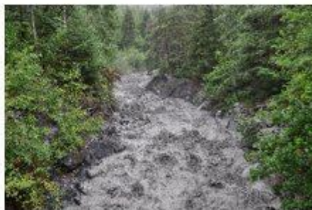
Le Torrent de Cry en crue

Lors des averses orageuses le ravinement des terrains pentus amène de nombreux sédiments meubles, allant de gros blocs à la boue extrêmement fine dans le lit du torrent. Mélangés aux eaux excédentaires dues à la forte intensité soudaine de la pluie pour former ce que l'on appelle une lave torrentielle, le phénomène va se diriger plus ou moins dans le lit du torrent et mettre en danger les habitants et constructions situés en aval (pont du Pré du Mayen arraché par les eaux en furie le 1 er août 2017). Des travaux visant à garantir la tranquillité des Chamosards ont été entrepris de longue date.