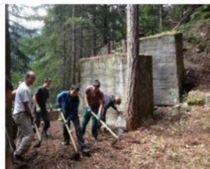
L'équipe de Degersheim aux socles de Faraire

En arrivant sur place, l'importance des structures témoins construites en 1942 vous impressionnera par leur ampleur. Selon l'acte de vente du matériel de la mine en 1946 stipulant que la hauteur des pylônes variait de 15 à 30 m, on peut penser, vu l'importance des socles, que la hauteur de la structure métallique atteignait certainement les 30 m. Par la suite les câbles porteurs et