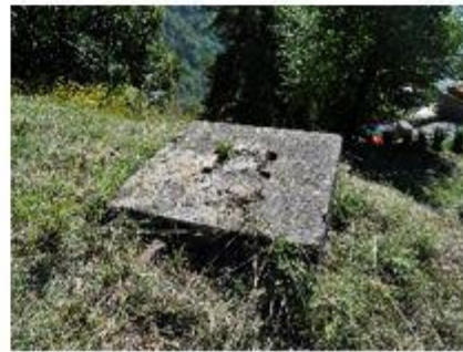
Socle à Azerin

En descendant sur la gauche de la route forestière, à la hauteur de l'avant dernière construction, à l'emplacement d'une petite place de parc, on peut remarquer au sol les restes de 3 socles en béton. Ces témoins historiques sont en danger là où ils côtoient l'Homme.