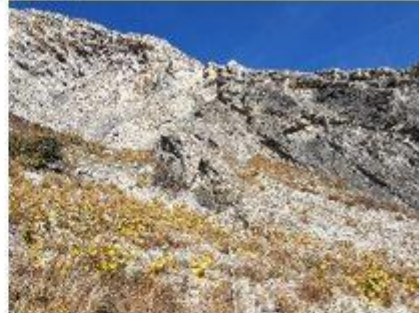
Le Valanginien inférieur

les efforts engendrés par la dérive des continents dans une direction Nord-Ouest l'ont exondée en la déformant en même temps que tout le massif. De ce point en direction de la Lizerne vous allez longer ce que l'on appelle la zone des racines de 4 unités géologiques distinctes appelées nappes de charriage. Il s'agit tout d'abord de la nappe de Morcles, ensuite de la nappe d'Ardon, de la nappe des Diablerets, puis de la nappe du Mont Gond. Les racines de ces nappes, aux resserrements près, stigmatisent la zone d'où sont issues ces dernières.