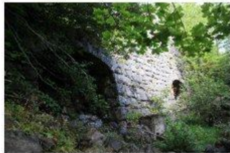
Soubassement de la station du téléphérique 2