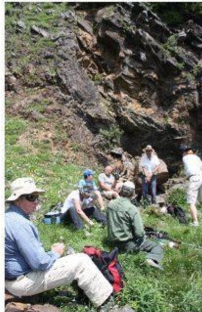
Devant l'entrée de la galerie 3

Des chantiers d'archéologie industrielle visant à retrouver les témoignages de ce passé prestigieux sont en cours.