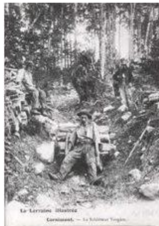
Exemple d'une descente de schlitte

Vu la déclivité du terrain, on peut s'imaginer des difficultés que rencontraient les transporteurs du minerai dans la première moitié du 19 ème siècle. La poussée que procurait le poids du matériel entassé sur la schlitte rendait la descente des plus périlleuse. La descente était entrecoupée, lors de portions moins déclives, de traction de la schlitte par des bœufs, lors de la traversée du pâturage des Pouays par exemple et entre la fin de la descente à Faraire et le départ de la prochaine dénivellation importante amenant à Applayes dans la zone supérieure des Vérines.