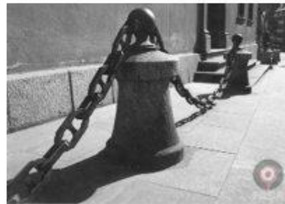
Sion, chaînes produites à Ardon