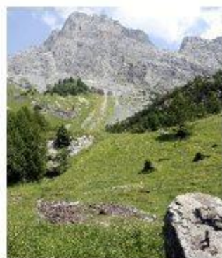
A droite le socle de départ du télé 1

Traversons maintenant le pâturage en direction du point 6.